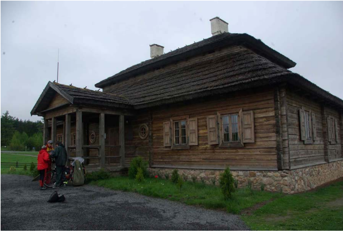
25. Мемориальный комплекс Т. Костюшко в Косово