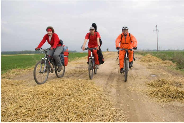
9. Дорога к Любче