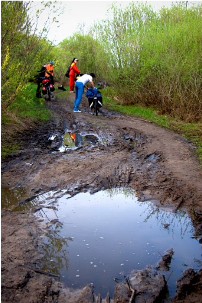
11. На стоянку к р. Неман