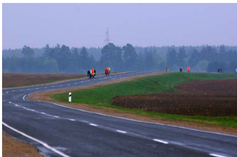
5. По дороге в Мир