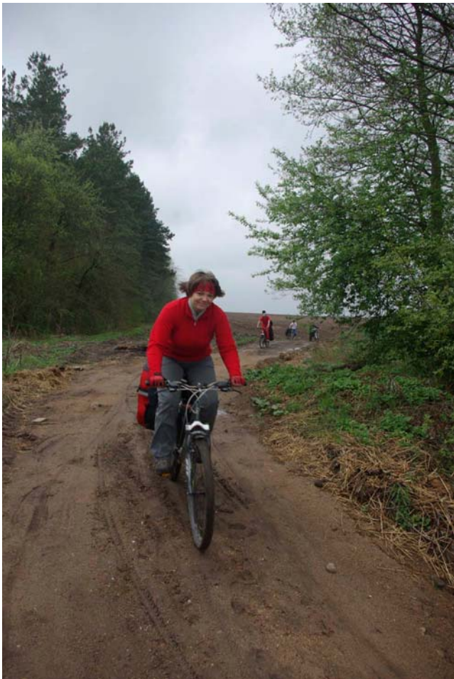
6. Дорога на бивак у Мира