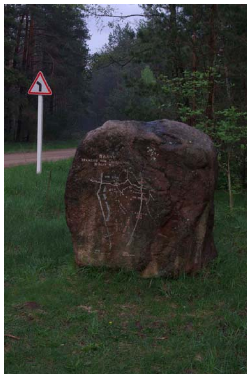
29-30. У д. Поддубно