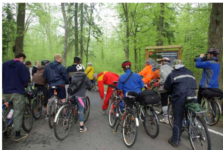
33-34. В Беловежской Пуще, экскурсия.