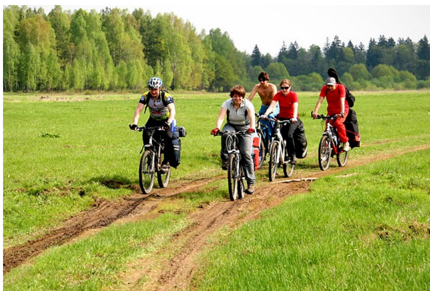
13. Дорога у Немана