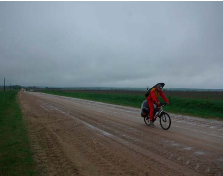
23-24. Дождливые дороги к Косово