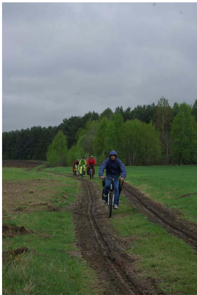
26-27. Дороги на Ружаны у деревень Кулеши и Колозубы