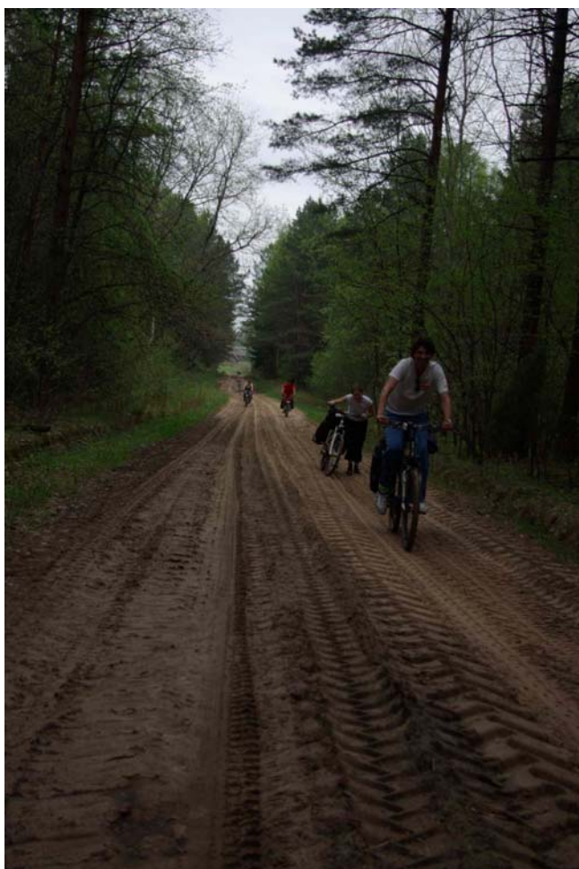
18. Дорога к р. Молчадь