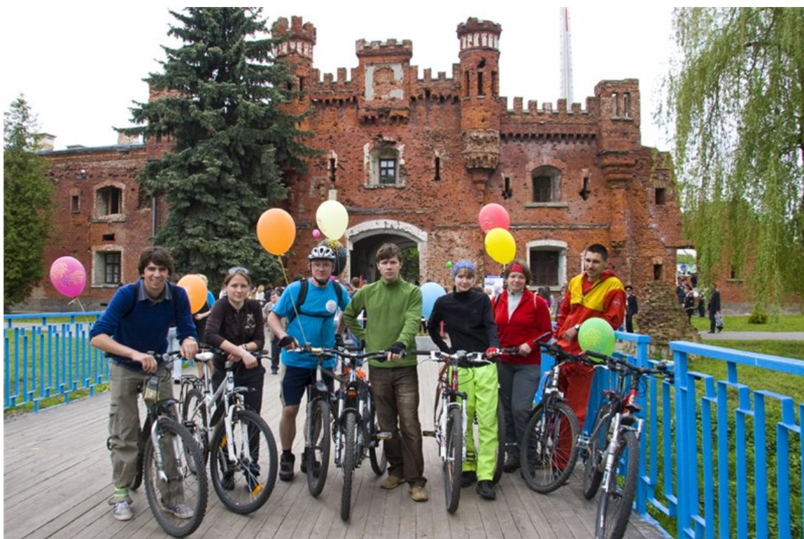
35. В Брестской крепости у Холмских ворот