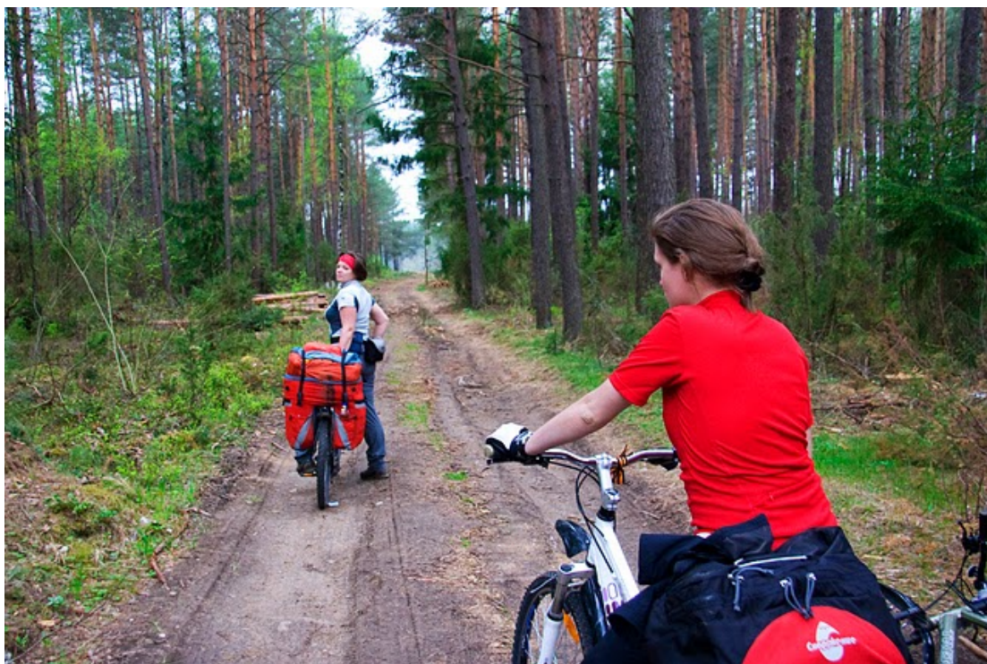
17. Дорога к р. Молчадь