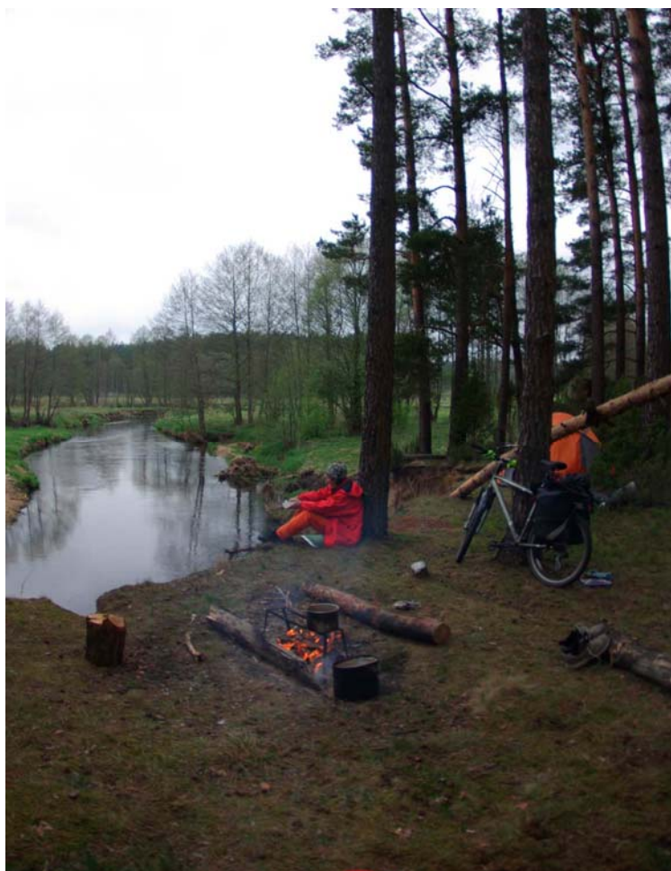
19. Бивак на р. Молчадь