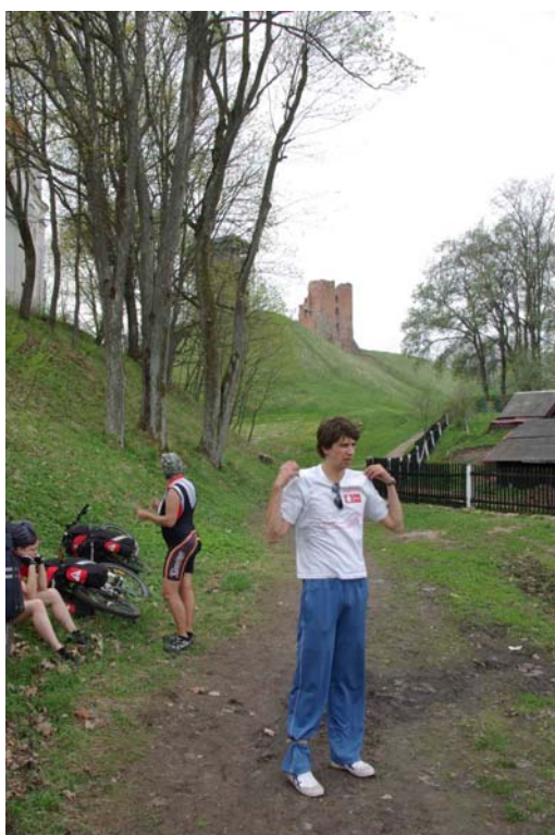
15. В г. Новогрудок