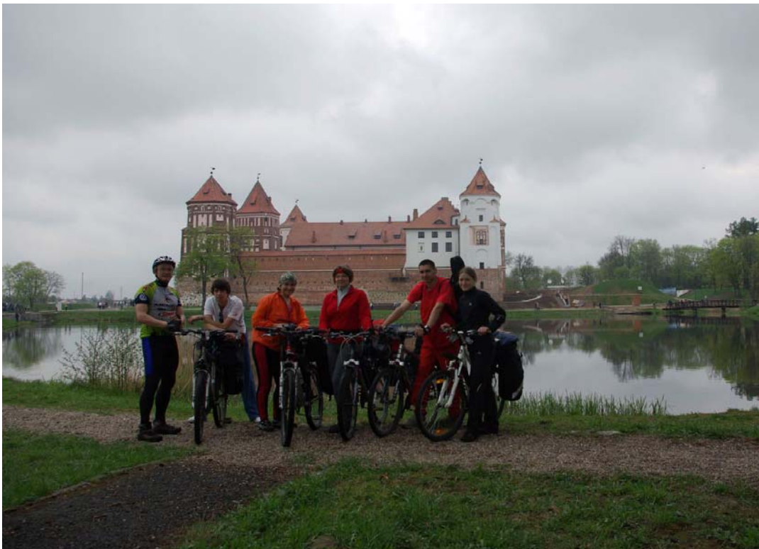
8. У Мирского замка