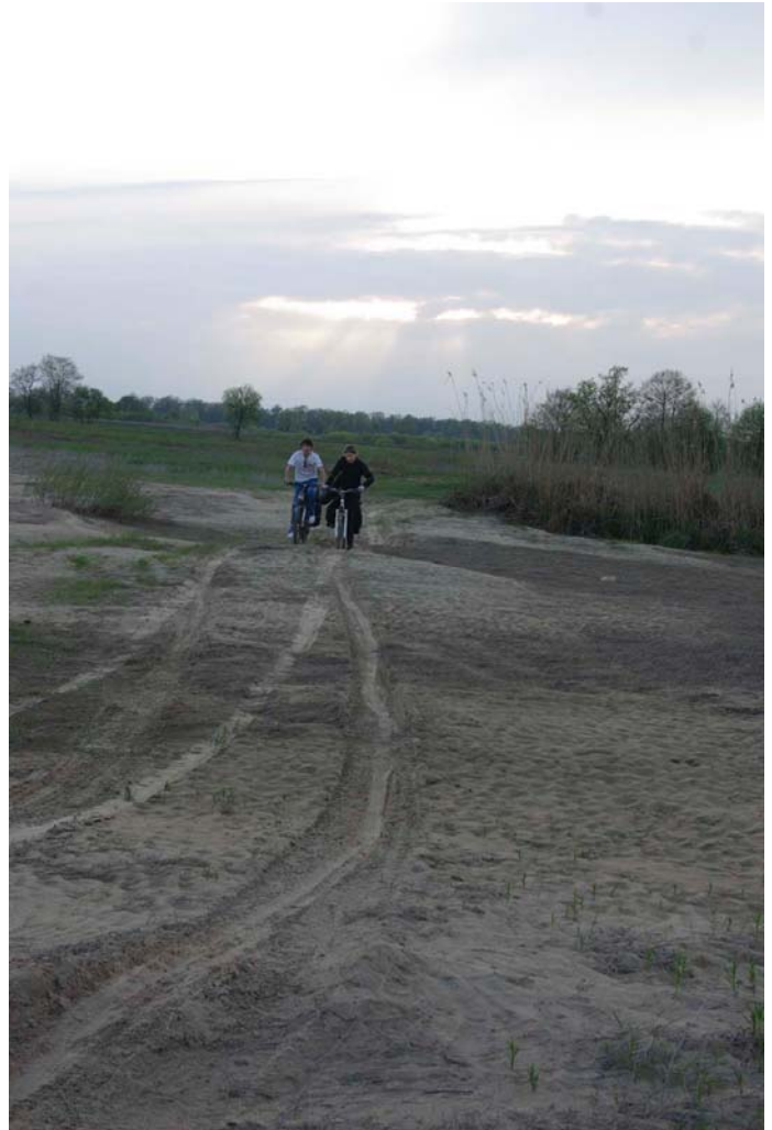
12. Дорога к стоянке по пескам