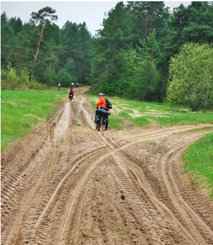
20. По пути к Новоельне