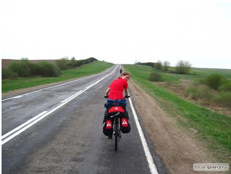
2. На трассе Барановичи - Несвиж