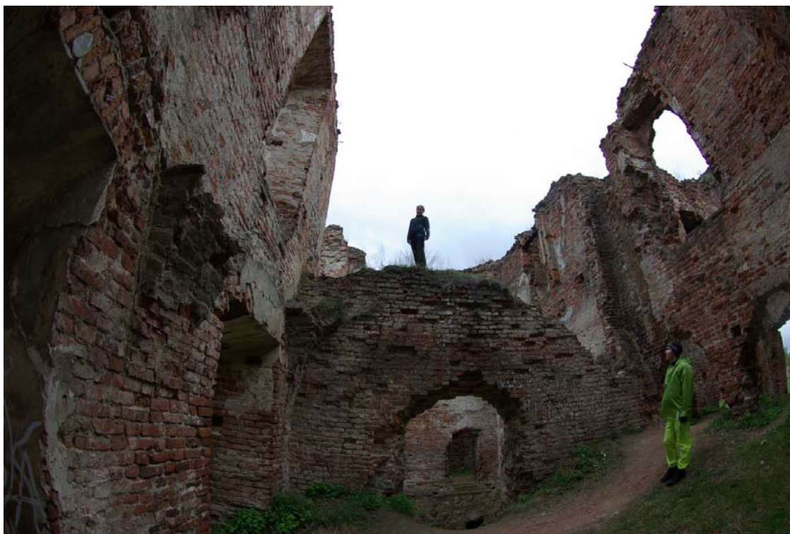
28. На руинах дворца Сапегов в Ружанах