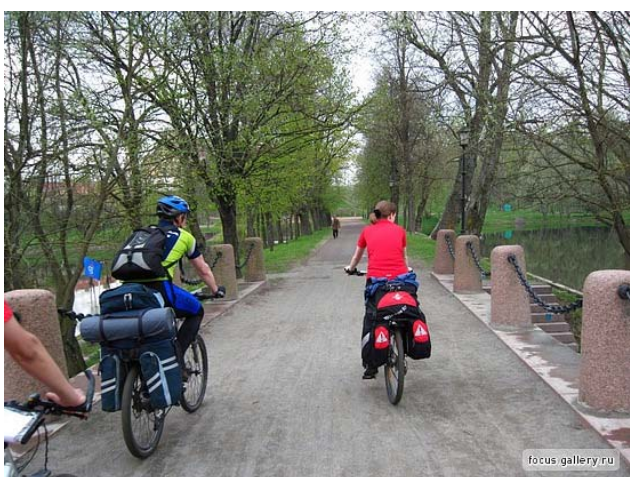
3. В парке Несвижа