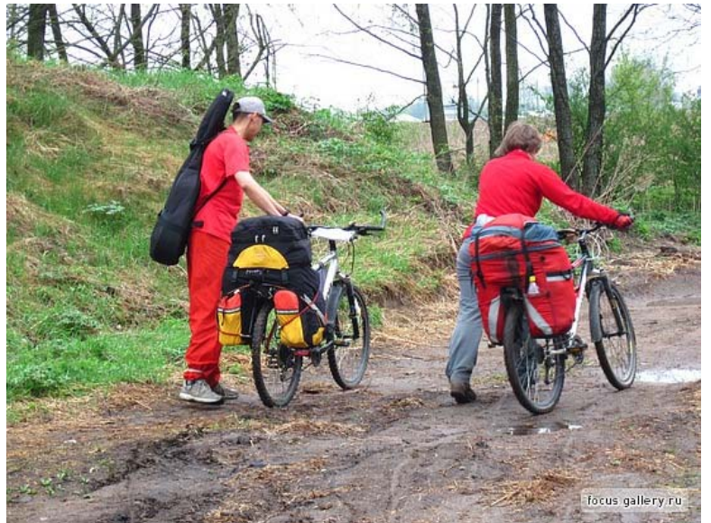
7. Дорога к замку в г. Мир