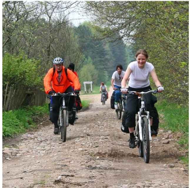
21. В д. Дукрово