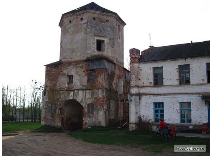
10. Замок в Любче