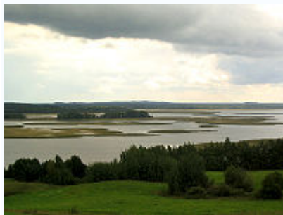
Браславский озёрный край.