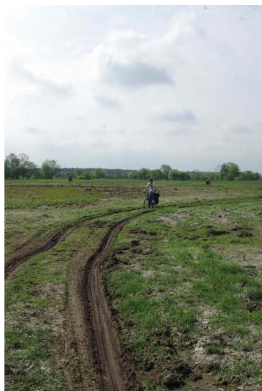
14. Назад к Любче