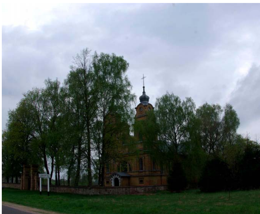
16. Село Дворец