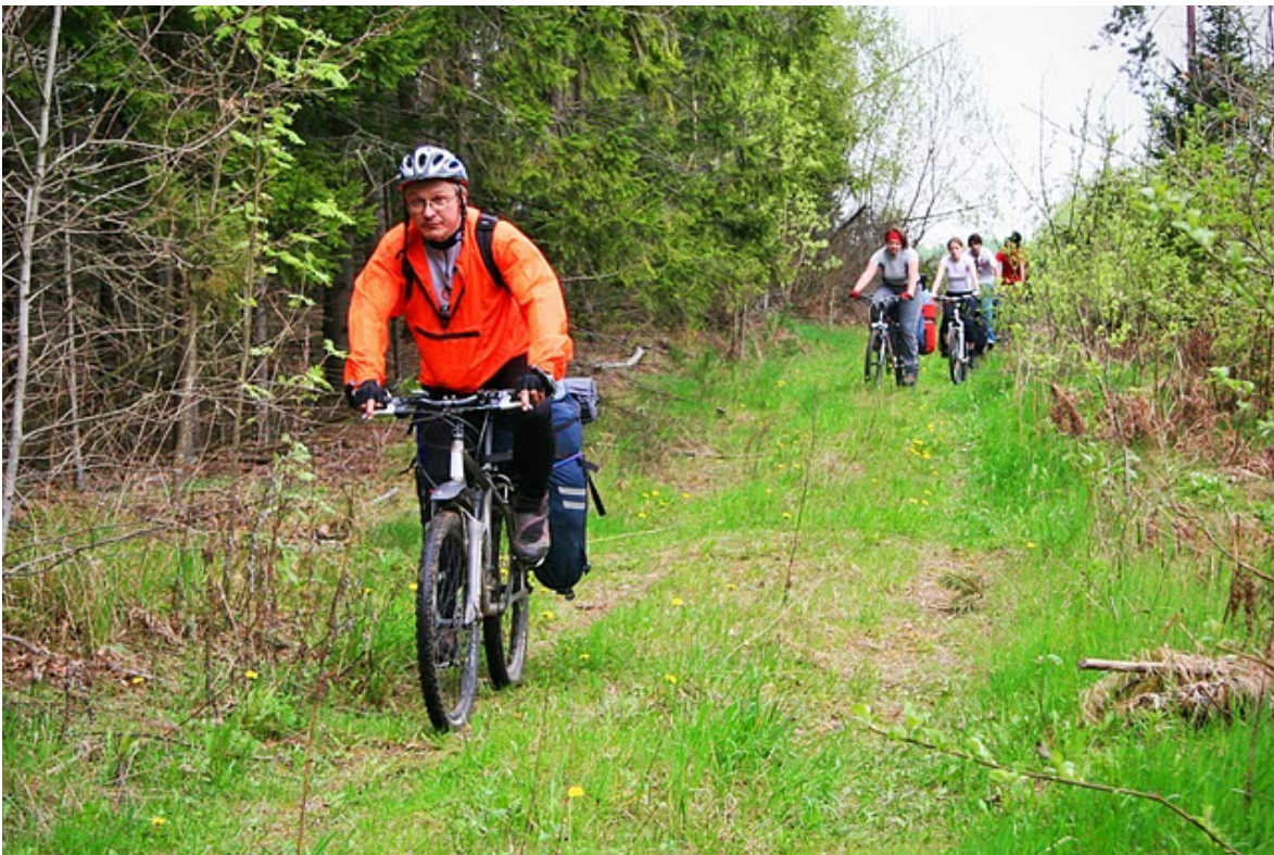
22. Лесные дороги от Дукрово до Баяр.