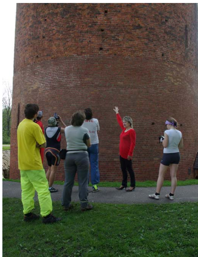
31. Встреча с параллельной группой