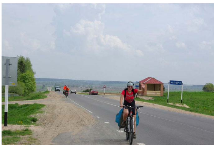
4. Дорога к Кореличам